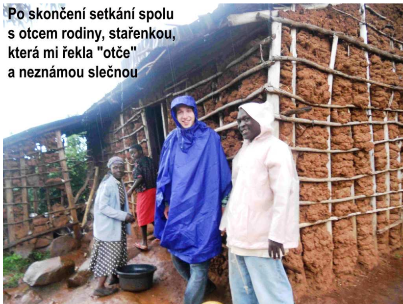
Po skončení setkání spolu s otcem rodiny, stařenkou, která mi řekla "otče" a neznámou slečnou