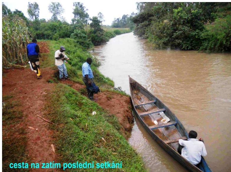
cesta na zatím poslední setkání

setkáním jsem pozdravil tamější stařenku: "Habari yako?" (How are you?) a ona odpověděla: "Musuri, baba." (I'm fine, father.). To už na mě bylo trochu moc.