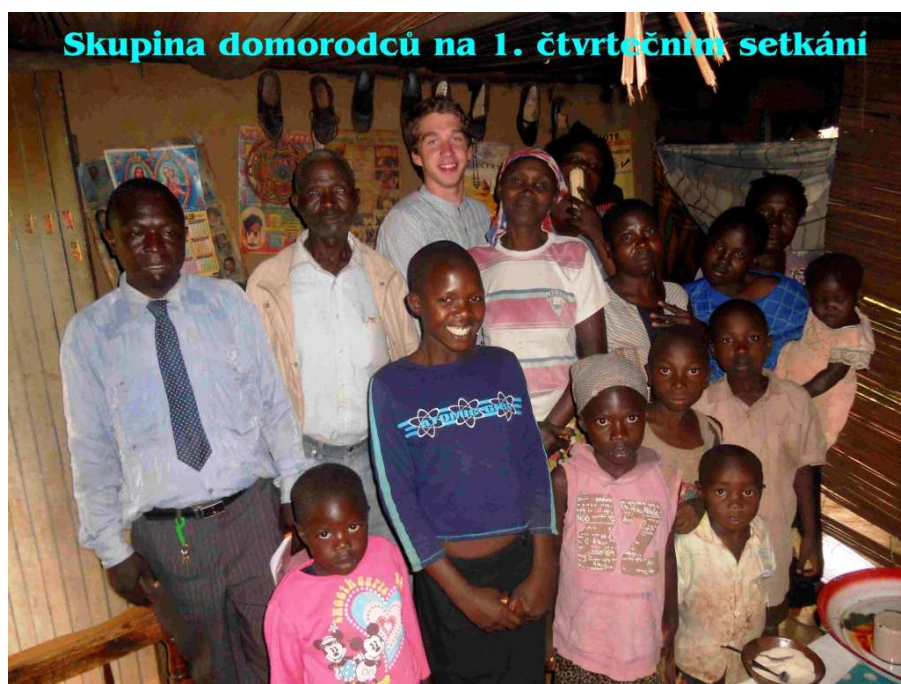
Skupina domorodců na 1. čtvrtěčním setkání