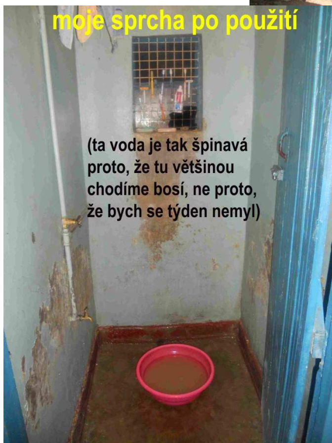
moje sprcha po použití

(ta voda je tak špinavá proto, že tu většinou chodíme bosí, ne proto, že bych se týden nemyl)