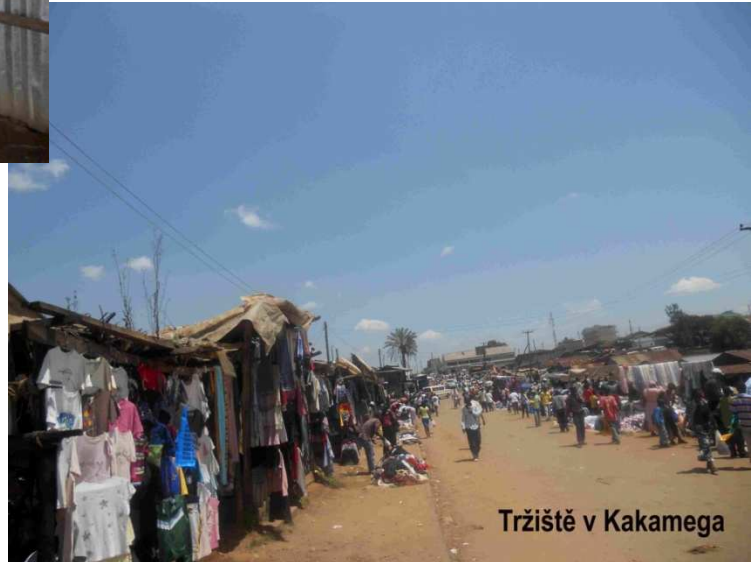
Tržiště v Kakamega

Dal jsem Micahovi peníze na 2 slepice, aby je koupil na trhu. Tam musí obchodovat beze mě. O cenách se totiž smlouvá, a když mě vidí spolu s ním, cena se během okamžiku zvýší alespoň na dvojnásobek. Ke slepicím jsem koupil rýži, brambory, limonádu a na závěr něco sladkého. Chtěl jsem dát každému z dětí i nějaký dárek na rozloučenou. Micah mi řekl, že může na trhu koupit všem tričko.