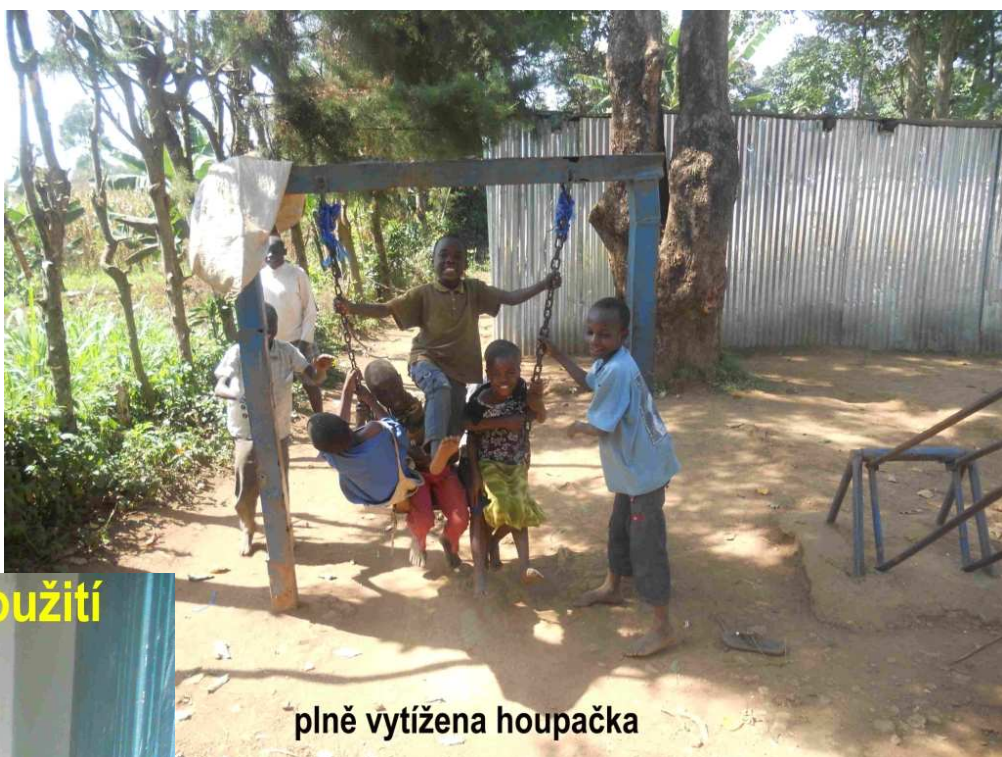
plně vytížena houpačka

zvířecí krev aj. Kolují o nich různé pověsti. Prý nikdy nespí a bojí se jich i lvi. Hlídači jsou to tedy skvělí. Když ale tito 3 mocní válečníci viděli můj foťák, staly se z nich najednou malé děti, které vidí hračku. Skoro jsem se od nich pak nemohl s foťákem dostat.