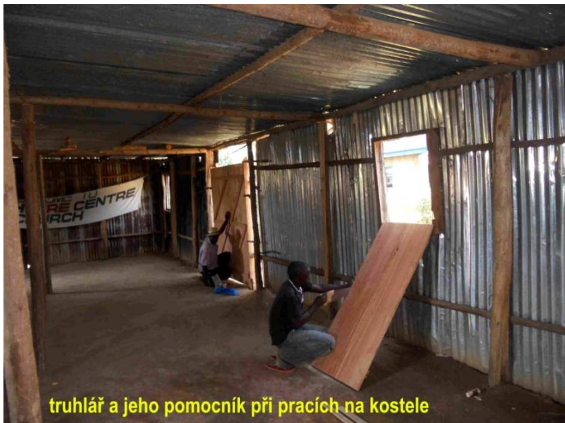
truhlář a jeho pomocník při pracích na kostele

V průběhu týdne k nám chodil truhlář a připevňoval dveře a okna. Snažil jsem se mu pomáhat, ale bojím se, že jsem ho spíš zpomaloval. Nyní chybí už pouze jedny dveře a práce je hotova. Kostel teď vypadá mnohem lépe. Skoro jako ty naše české :).