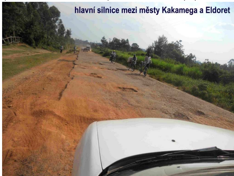
hlavní silnice mezi městy Kakamega a Eldoret