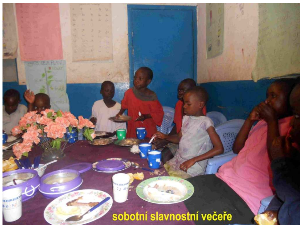
sobotní slavnostní večeře

nějakým časem dětem řekl, že jsem ještě nikdy neviděl zabíjení slepice, přemluvily mě, abych se na to podíval. Musím říct, že jsem měl docela problém to ustát bez ztráty vědomí a zvracení. Je zvláštní, že