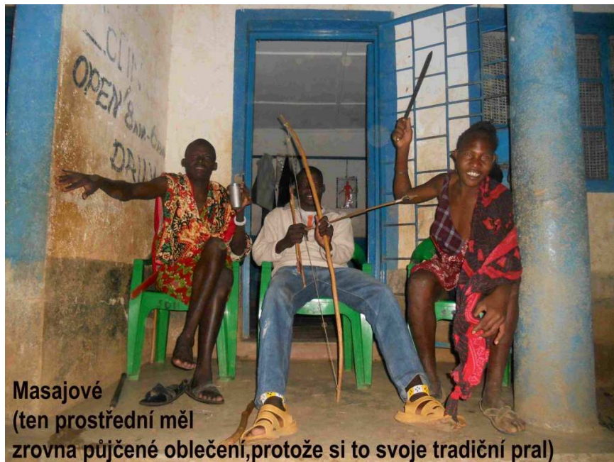
Masajové (ten prostřední měl zrovna půjčené oblečení, protože si to svoje tradiční pral)

K večeri jsme pozvali i tři Masaje, kteří nám tu slouží jako hlídači objektu výměnou za střechu nad hlavou pro deštivé noci. Masajové jsou zvláštní kmen. Jako jediní černoši, jež jsem potkal, si i přes život poblíž velkých měst drží své tradice. Oblékají se pouze do fialových a červených hadrů, všemožně si znetvořují uši (dělají do nich velké díry, protahují je,...), sami si vyrábějí zbraně, s jejichž pomocí loví malá zvířata, pijí